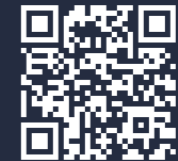
법무법인 정의 유튜브

공식 유튜브 채널과 블로그에서도 주요 사건과 법률 정보를 확인하실 수 있습니다.